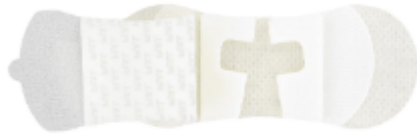
Code article HUG : 495669

S'assurer de la compatibilité entre les ailettes du PICCLine et le système de fixation Grip-Lok® pour une bonne stabilité. Les deux modèles ci-dessous sont compatibles avec le Power PICC Line Bard® et le Power PICCLine Solo Bard® (cf. technique clinique de soins et surveillance PICCLine, 2023).