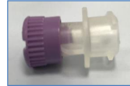
Raccord à adapter à l'extension du bouton Mic-Key (ne se trouve que dans le kit tubulure entérale)