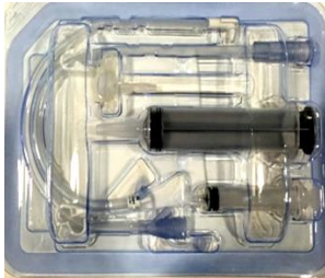
kit complet : bouton gastrostomie