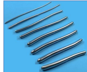
Bougies de Hégar (Permettre une dilatation)