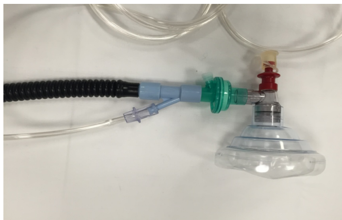
Jackson Reese monté pour Aérosols doseurs