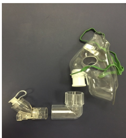
Masque (petit ou grand) + Coude strié + Aéroneb