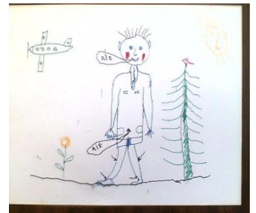
« L'arbre, c'est pour me pendre si mes douleurs sont toujours présentes » Mr R.