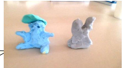
«Moment de détente » Mr M.