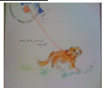
« Mon plus grand regret » Mr G

Groupe trouvant du sens dans une unité de soins palliatifs. Permet un espace et un temps de vie aux participants.