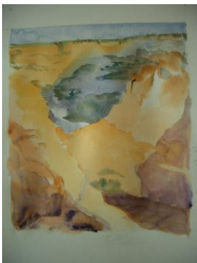
«Le canyon de la mort » Mme G