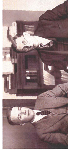
Charles Best et Frederick Banting