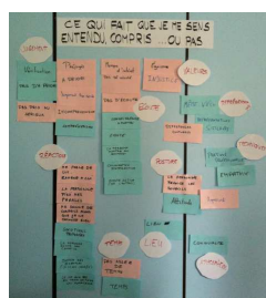
Analyse d'expérience personnelle