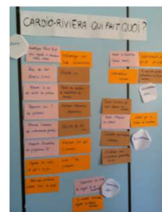
Jeux de rôles