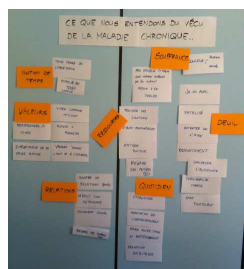
Analyse de vidéo