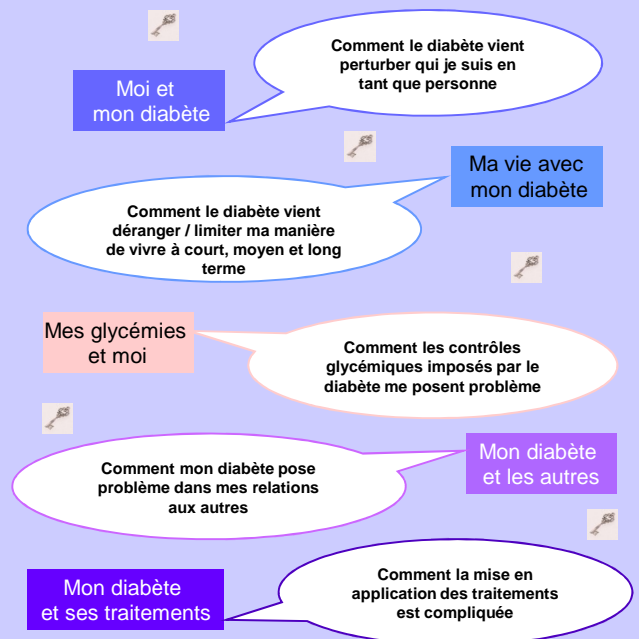
Illustration: Les problématiques exprimées par les patients diabétiques