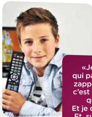
* Mon enfant n'est pas un cœur de cible. De Jean-Philippe Desbordes. Ed. Actes Sud, 2007.

Reste à savoir si le pays n'a pas un train de retard. Certes encore très répandu, l'usage de la télévision perd peu à peu du terrain, aux yeux des juniors, face aux ordinateurs et aux téléphones portables, constate JAMES, une étude financée par Swisscom qui sonde chaque année leurs loisirs médias. Problème: sur internet, les messages commerciaux sont le plus souvent «cachés», ajoute Louise Ekström, pour qui même la loi suédoise, faute de surveillance suffisante, n'est pas adaptée pour lutter sur la Toile.