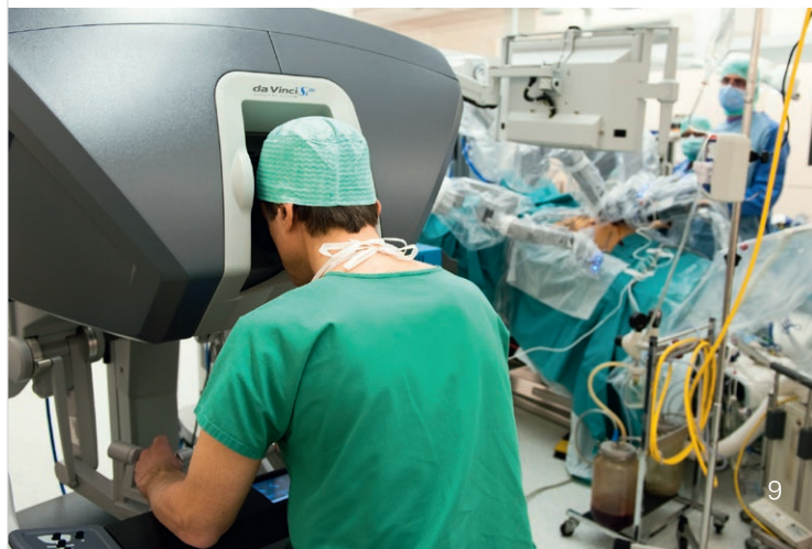
Chirurgien opérant avec le système Da Vinci

Destruction des tumeurs par ultrasons focalisés : la technologie Focal One repère les foyers cancéreux sur des images tridimensionnelles et les détruit par la chaleur à l'aide d'ultrasons de haute intensité.