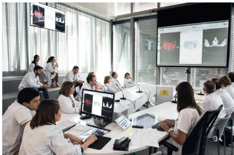
Partage d'expertises lors d'un tumor board

Ce groupe expert examine votre situation afin d'établir ou de confirmer un diagnostic. Il définit une stratégie thérapeutique personnalisée en fonction de votre état de santé et de l'évolution de votre maladie. Les propositions de traitement sont ensuite transmises à votre médecin de famille, qui a également la possibilité de participer au tumor board .