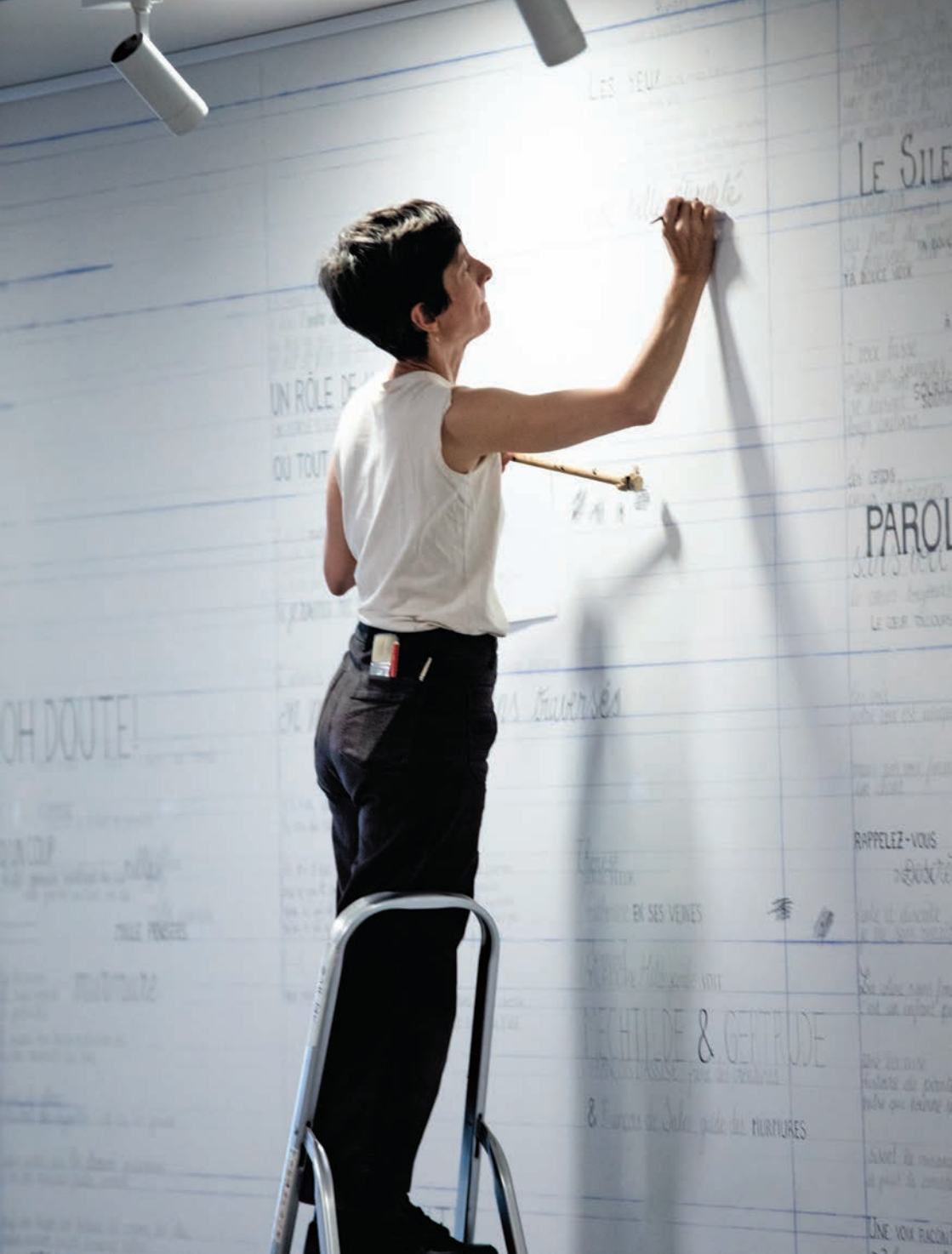
Fresque À voix basses en création - ©Ariane Mawaffo