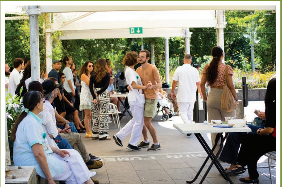
Concert de Matheus Fonseca, terrasse Opéra - ©Ariane Mawaffo