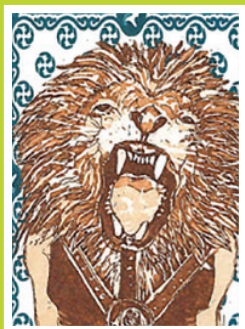
Ines Verdia stagiaire semestre de printemps