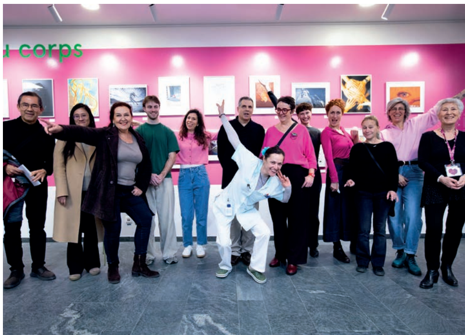
Vernissage - ©Ariane Mawaffo