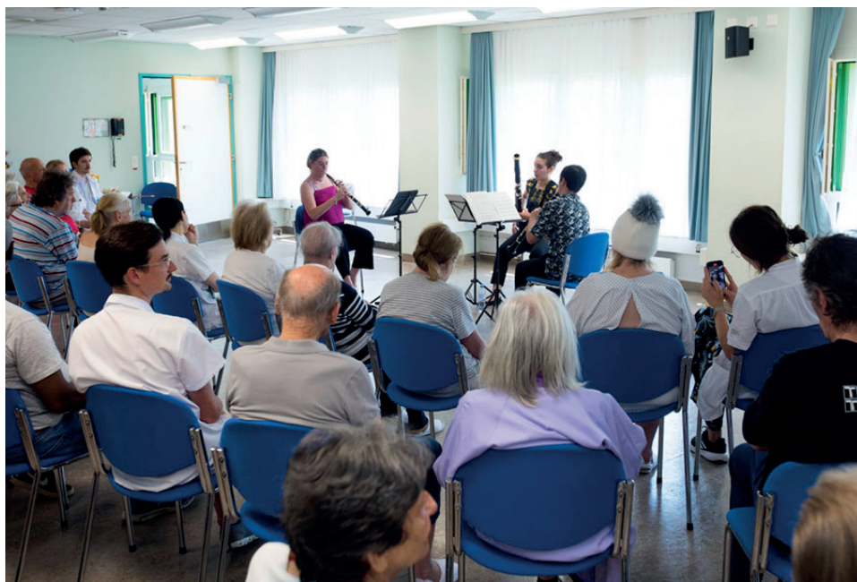
Haute école de musique en psychiatrie gériatrique