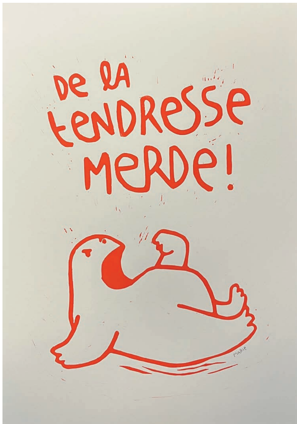
De la tendresse merde ! - Marie Aurore Conscience - linogravure