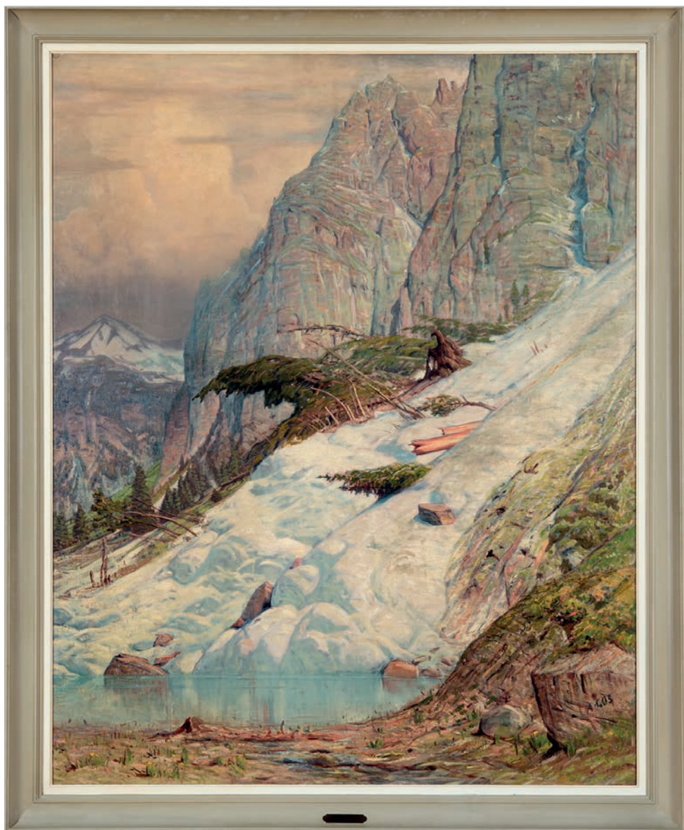
L'avalanche , Albert Gos, 1885. Œuvre léguée au Musée d'art et d'histoire