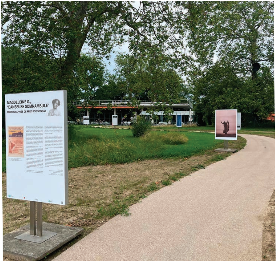
Somnambulisme, art brut et planète Mars, photographies de Fred Boissonnas - ©Michèle Lechevalier