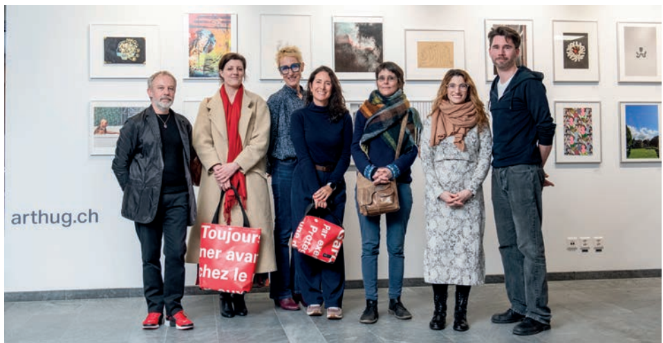
Jury et lauréates