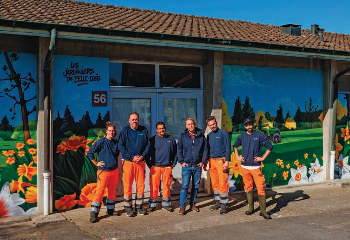
Fresque de Jazi en compagnie des membres du Secteur jardins, Belle-Idée