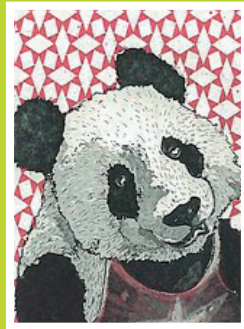
Maxence Höcht stagiaire semestre d'automne