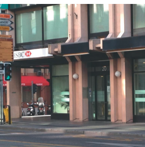
L'entrée du 20bis, rue de Lausanne

Le type de prise en charge proposé au programme Troubles de l'humeur est déterminé et organisé en collaboration avec vos soignants référents.