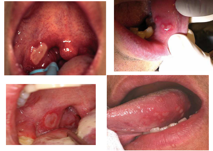
Scully C. Aphthous Ulceration. NEJM 2006 ;355:165-72 Messadi D, Younai F. Aphthous Ulcers. Dermatologic Therapy, vol.3, 2010:281-290