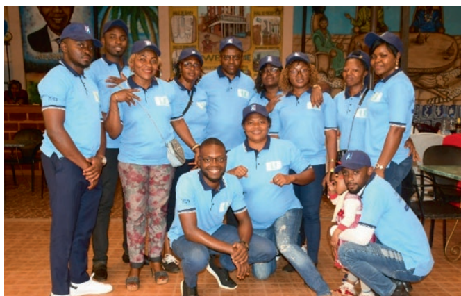
Equipe 3T lors la fête du 1 er mai à Dschang

En plus, les événements d'envergure ont été exploités, à l'instar de la journée internationale des droits de la femme (8 mars 2022) et la fête du travail (1 er mai 2022).